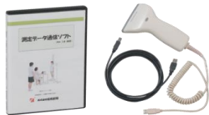
測定データ通信ソフトセット