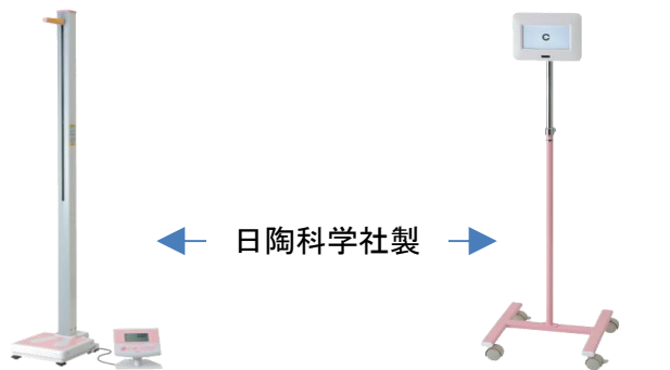
全自動身長体重計「健診くん」